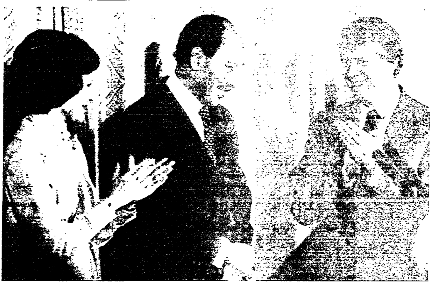
▲ كارتر وزوجه بمقتاب بعد كلمة السيدات